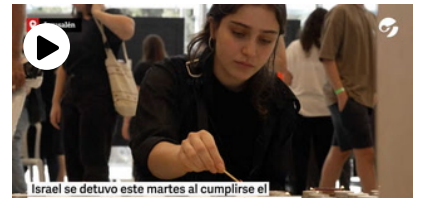
Israel se detuvo para honrar a las víctimas y presionar al gobierno a un mes del ataque de Hamas