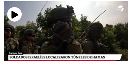
Operaciones de la incursión del ejército israelí en el interior de Gaza